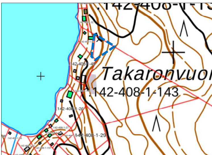
Sijainti peruskartalla 2023